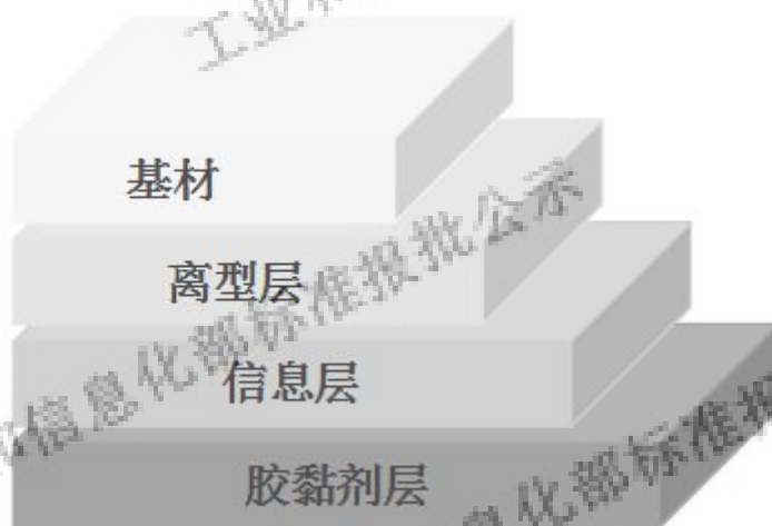
图 A.1 烫印箔的基本构成示意图