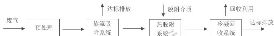
图2 挥发性有机物旋流吸附-冷凝回收装置工艺流程图

含挥发性有机物（简称“VOCs”）废气先进行预处理，以去除夹带的粉尘、雾滴及有毒气体，预处理后的气体中仅含VOCs。VOCs废气在旋流吸附系统进行VOCs吸附去除，净化后气体达标排放，此时热脱附系统和冷凝回收系统均不工作；吸附系统一般工作30天以上。当旋流吸附系统达到饱和后，开启热脱附系统和冷凝回收系统，脱附介质一般为热氮气，热氮气夹带高浓度VOCs进入冷凝回收系统，把VOCs全部冷却为液相并回收；热脱附和冷凝系统一般工作3 h~12 h。吸附和冷凝交替进行。